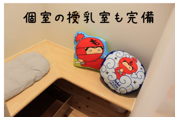
個室の授乳室も完備